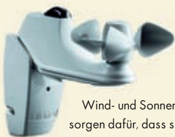
Wind- und Sonnensensor sorgen dafür, dass sich Ihre Markise selbständig und in kurzer Zeit jedem Wetter anpasst