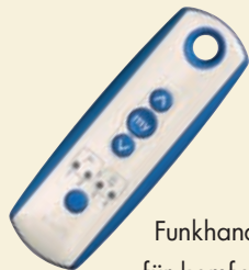
Funkhandsender für komfortable Steuerung Ihrer Markise