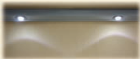
Lichtschiene, dimmbar für angenehme Atmosphäre auf Ihrer Terrasse oder Balkon